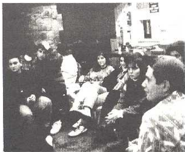
One of the Haytoug discussion groups