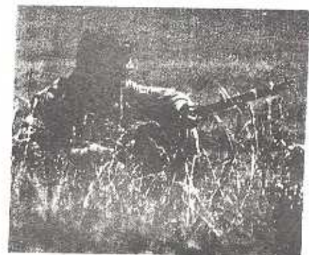
A freedom fighter waits for battle