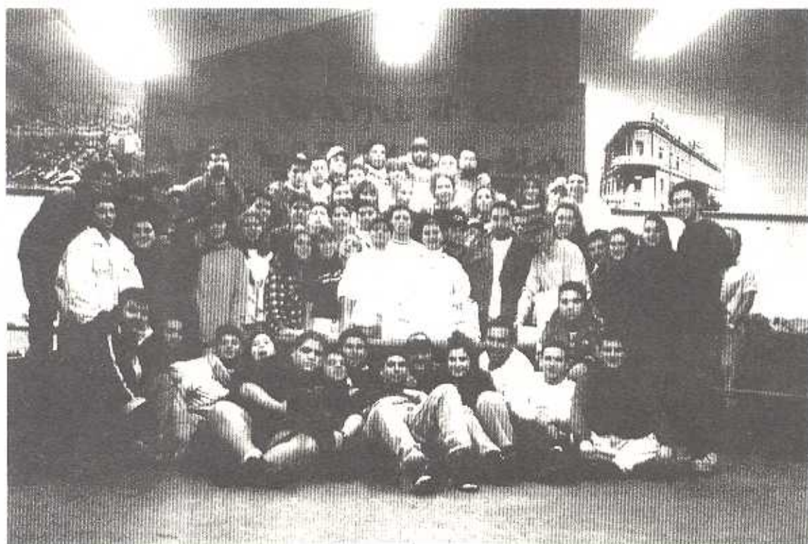
The Participants of the 1993 Educational Seminar