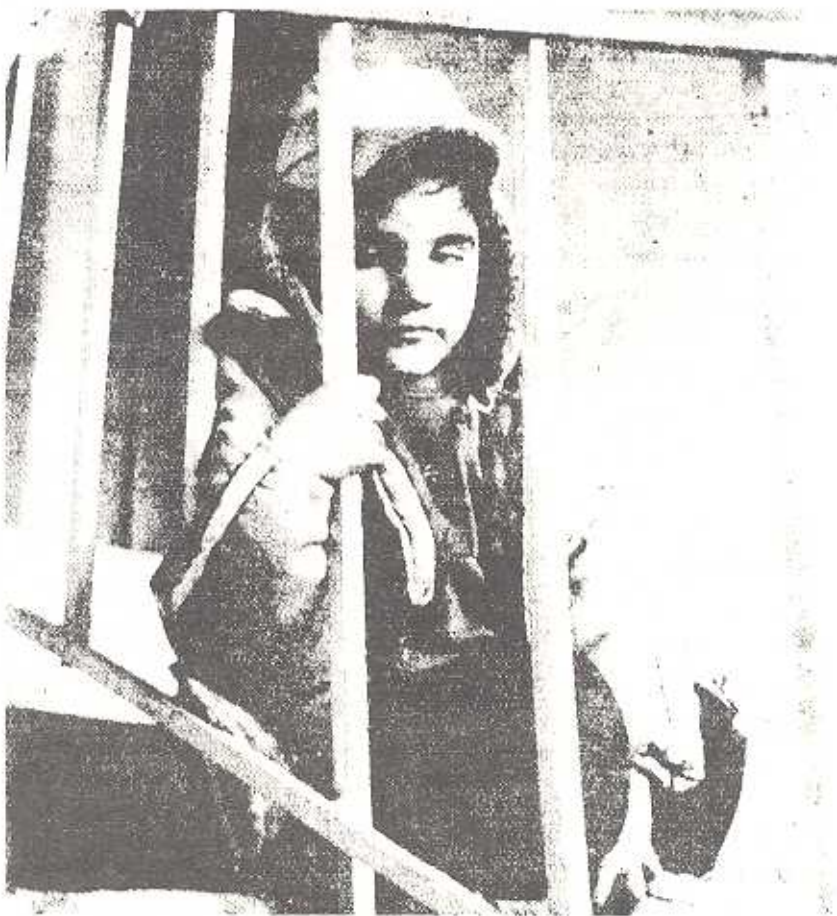
An Armenian Youth

Thus, we call on all organizations within the Armenian-American community and all Armenians to bring their generous participation in all aspects of "Operation Winter Rescue". With unified force and the belief in the future of our homeland, our people undeniably, decisively conquer all obstacles.