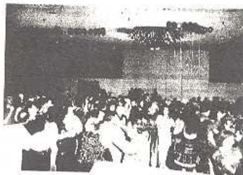
Some of the supporters dancing up a storm

The next event commemorating the A.Y.F. 60th Anniversary is the San Francisco Rosdom chapter's Boat Dance on February 6, 1993.