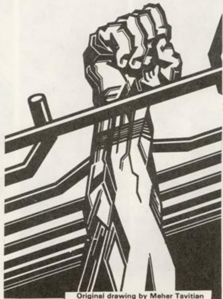
Original drawing by Meher Tavitian