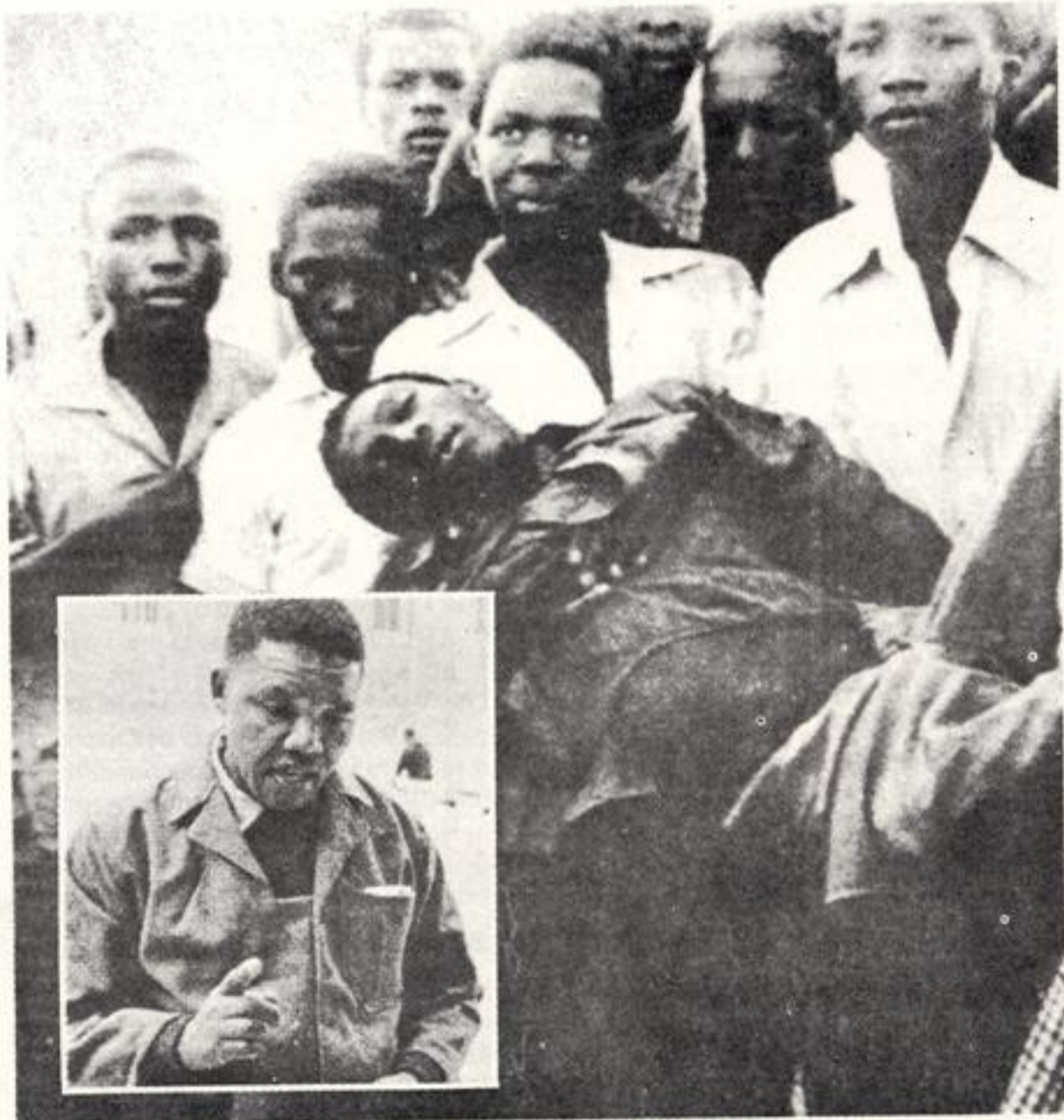
Police violence has greatly escalated in recent months. In Zwide, April 14 police shot five mourners at the funeral of four victims of an earlier clash. (Inset) ANC leader Nelson Mandela, imprisoned at notorious Robben Island for over 20 years.